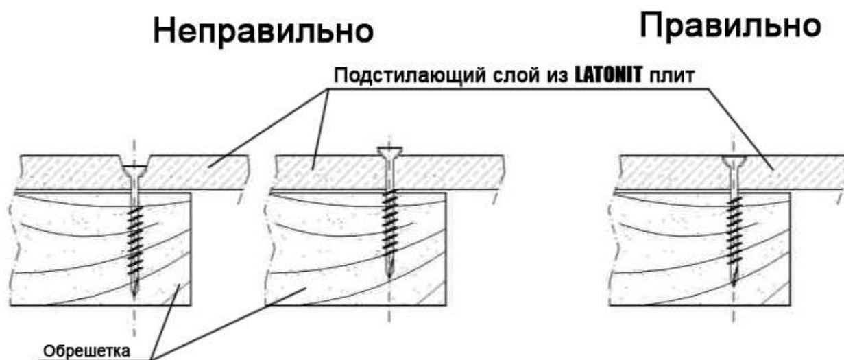
Крепление плит LATONIT к обрешетке кровли

Крепление плит к обрешетке кровли осуществляется саморезами, при этом верхняя плоскость шляпки самореза должна быть на уровне с верхней плоскостью плиты. Дальнейшее покрытие кровли кровельным материалом осуществляется в соответствии с технологией их монтажа.